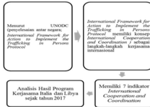
Figure 1: Analisis Konsep International Cooperation and Coordination terhadap pelaksanaan Kerjasama Italia-Libya 2017

Hasil 7 indikator International Cooperation and Coordination akan dilakukan analisis lebih lanjut terhadap program kerjasama antara Italia dan Libya dalam melakukan penanggulangan kejahatan perdagangan manusia sejak tahun 2017.